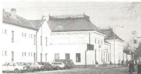
La stacidomo en Hodonin, loko de la antaŭkongreso de la 49a IFK, rekonstruita en la jaro 1994